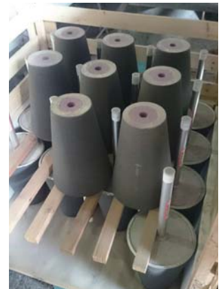
ポーラスプラグ製品例 Examples of porous plugs