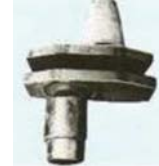
セット図例 Example of installed SN plate